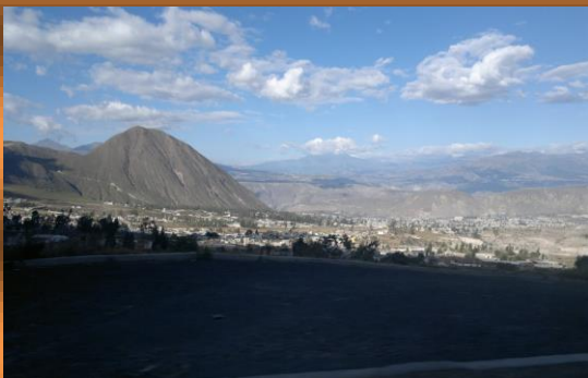
Vista panorámica del barrio San Antonio de Pichincha

También se utilizará material gráfico de archivo para incluir escenas en la frontera oriental entre Ecuador y Colombia.