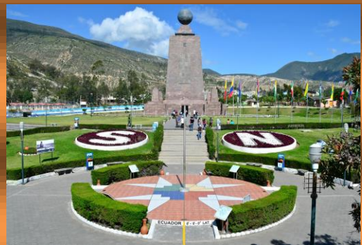
Ciudad Mitad del Mundo