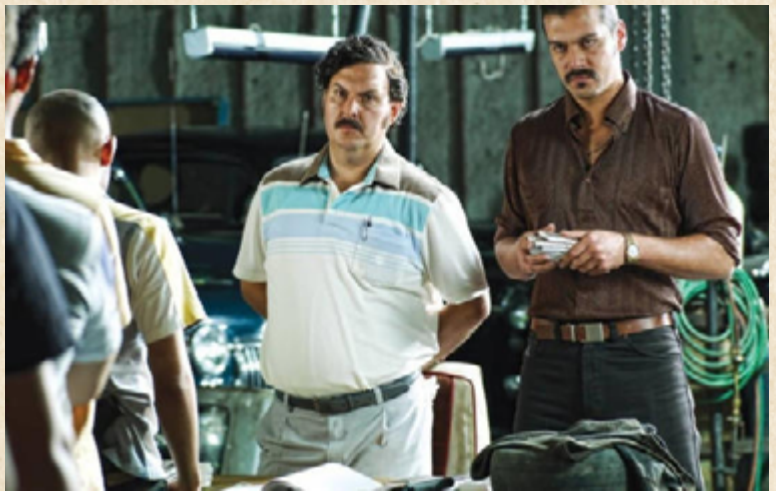
Escobar, el patrón del mal (Caracol TV, 2012)

Yo soy Betty, la fea , creada por Fernando Gaitán y producida y emitida por el canal nacional RCN desde octubre de 1999 a mayo de 2001, y Escobar, el patrón del mal , producida y emitida por Caracol Televisión entre 2009 y 2012, son dos ejemplos de series realizadas por televisoras privadas que lograron tener un gran éxito a nivel nacional.