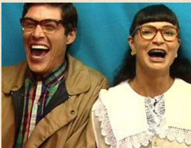
Yo soy Betty, la fea (RCN, 1999)

La televisión en Colombia, tradicionalmente, ha sido reconocida alrededor del mundo por una fuerte producción de telenovelas. La novela Yo soy Betty, la fea (RCN 1999-2001), creada por Fernando Gaitán, logró un gran éxito del público nacional llegando a un rating máximo de 54.7 en su momento más álgido. También, dentro del contexto cinematográfico colombiano, las comedias han logrado llevar más público que otros géneros a las salas de cine. Soñar no cuesta nada (2006), dirigida por Rodrigo Triana, es catalogada como la película colombiana más taquillera dentro del país, con más de un millón de asistentes.