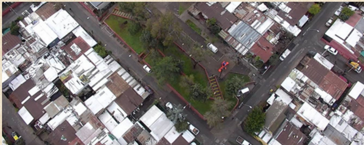
Referente de la ciudad en la que se desarrolla la historia.

Finalmente, Hermes es un instructor de conducción por lo tanto las calles de la ciudad son un elemento que siempre estarán presente en todos los episodios de la serie. Son las calles de una pequeña ciudad, con poco desarrollo de la infraestructura vial y llena de gente intolerante al volante.