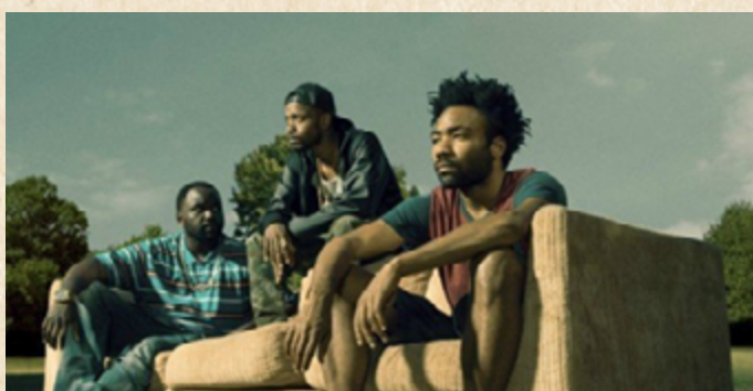
Atlanta (FX, 2016)