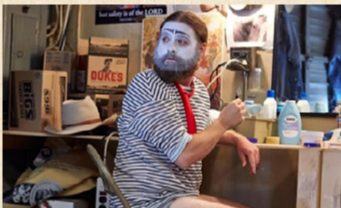
Baskets (FX, 2016)

Estos son un ejemplo de lo que busca HERMES en su historia, poner al protagonista fracasado, en un ambiente donde está totalmente sobrecalificado para realizar la más básica e irrelevante de las actividades.