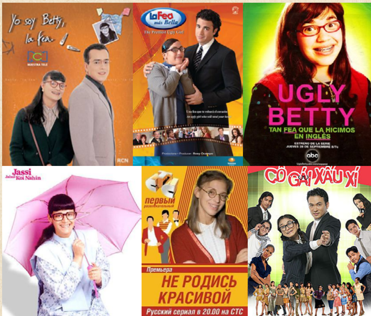
Yo soy Betty, la fea (RCN, 1999-2001) es catalogada como la novela más exitosa a nivel mundial. Se realizaron más de 20 adaptaciones una vez finalizada su emisión en Colombia.

Teniendo en cuenta estos factores, el contexto de la televisión colombiana y la comunidad de amantes del automovilismo en el país, se considera que HERMES es un proyecto viable.