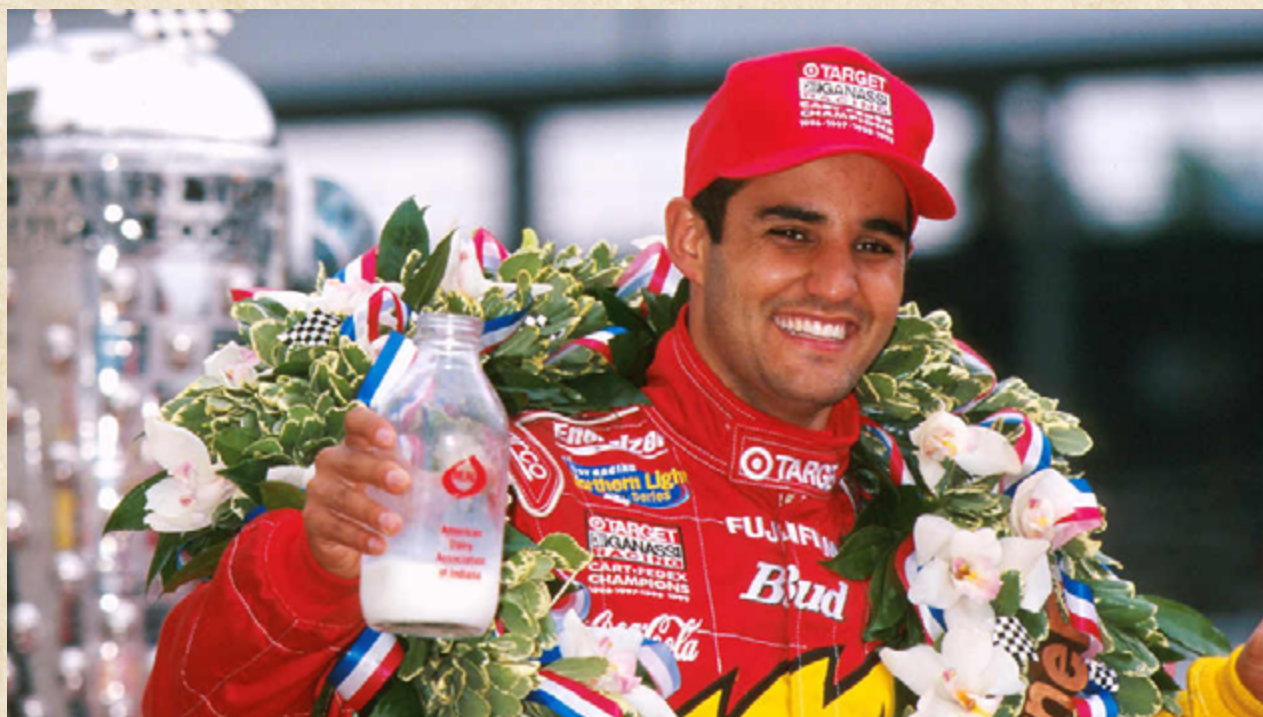
Juan Pablo Montoya, ganador de la serie CART (1999)

Mundialmente existe una comunidad muy grande que sigue las carreras automovilísticas, tan solo la Fórmula 1, la modalidad más rápida de esta práctica, tuvo en 2016 cerca de 352.3 millones de espectadores a lo largo y ancho del planeta. Este es un número importante de personas a las cuales HERMES podría apuntarle, como público secundario, una vez la serie termine su emisión en Colombia y sea emitida o adaptada en otros países.