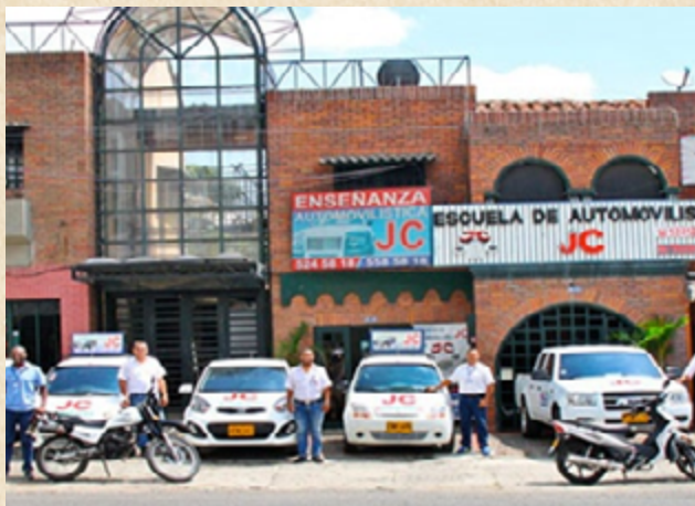
Referente del exterior de la autoescuela.

HERMES es una serie que desarrolla su trama dentro del contexto urbano. La ciudad y sus espacios tienen mucha importancia dentro de la historia ya que ayudan a reflejar el fracaso en el que ha caído el personaje principal.