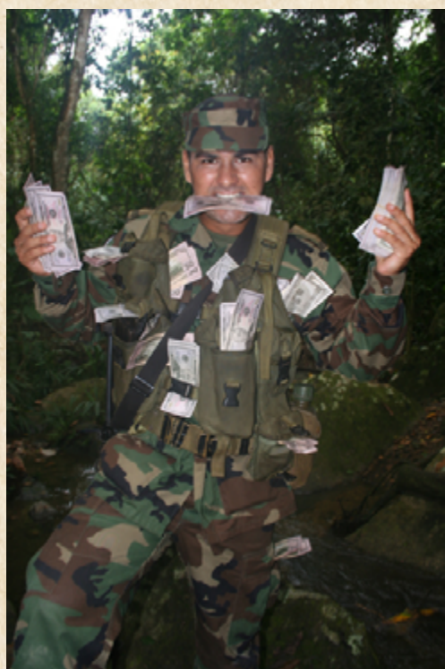
Soñar no cuesta nada (2006)

Teniendo en cuenta lo anterior, las televisoras colombianas están buscando migrar del formato de telenovela a series que narren historias aptas para mezclar las temáticas de comedia y drama con un look cinematográfico, para así poder captar más televidentes cada noche. Un claro ejemplo de esto es la serie A corazón abierto (RCN 2010-2011), escrita por Fernando Gaitán, que logró romper el récord de rating nacional que tenía Yo soy Betty, la fea .