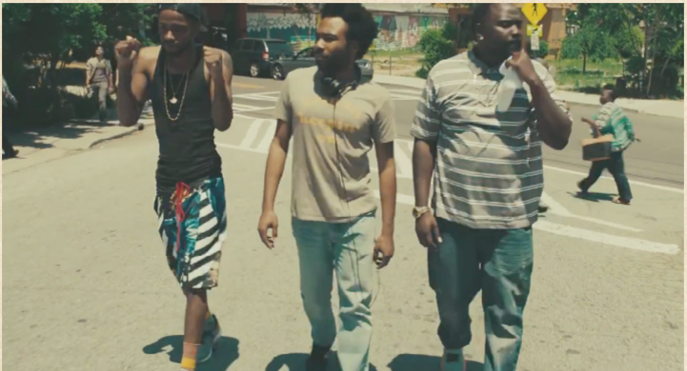
Referente de las calles de la ciudad. Atlanta (FX, 2017)