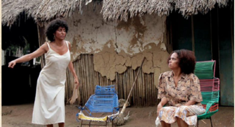
Déjala morir (Telecaribe, 2017)

Déjala morir , escrita por Andrés Salgado y emitida por el canal regional Telecaribe en marzo de 2017, esta miniserie, de 10 capítulos de 30 minutos, tuvo un presupuesto aproximado de 30 mil dólares por episodio. Esta serie logró revivir el rating de este pequeño canal regional llegando a los 6 puntos, más de lo que logran algunas noches los principales canales privados como RCN