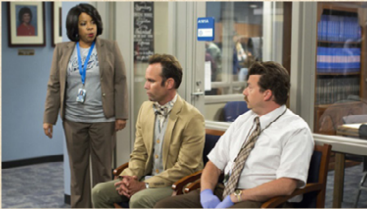
Referente de la vestimenta de los personajes. Vice Principals (HBO, 2016).

El color define un escenario de valores emocionales que potencializan el sentido e intención de la serie; en este caso se plantea la utilización de tonos pasteles para transmitir el tedio y una atmósfera aburrida que evoca el mundo de las autoescuelas. Mantener un equilibrio entre tonos no muy oscuros o tonos muy agresivos a la vista, muy poco contraste en la imagen.