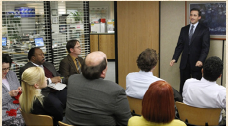
Referente de los decorados de la sala de reuniones. The Office (NBC, 2005).