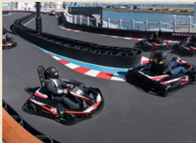
Referente de la pista de karts.

La principal locación es la oficina de la escuela de conducción, este es el espacio donde Hermes desarrolla sus amistades, encuentra el amor y convive con su enemigo. Además la falta de glamour de este espacio, es el constante recuerdo para el protagonista de lo bajo que ha caído.