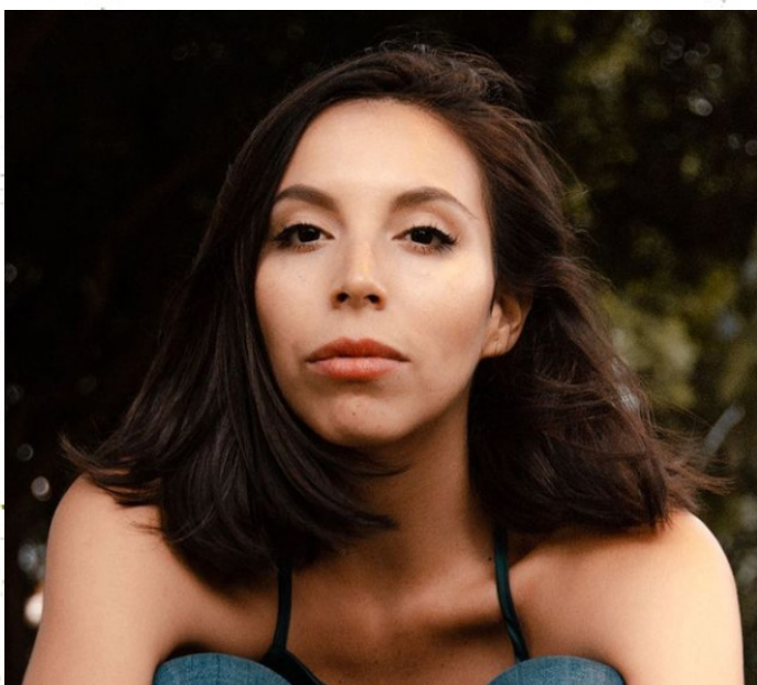
Similar a la actriz Belú Idrobo

Confía en su defendido, pero ante los desacatos de Armando dentro de la cárcel, ella se vuelve más severa, desconfiada y con una sensibilidad más reservada.