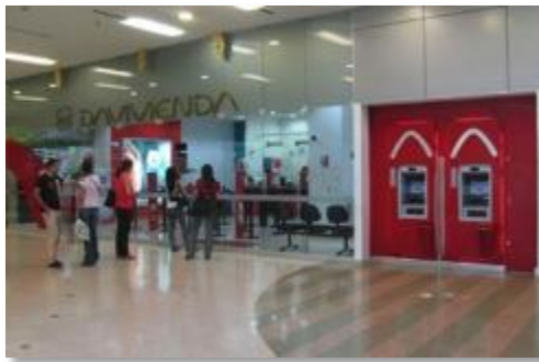
Davivienda. Banco colombiano. Referente para el cortometraje.

El banco es un espacio frío, de colores pálidos, mucho vidrio y mucha luz. Es una sucursal pequeña, con pocas cajas de atención y pocos clientes.