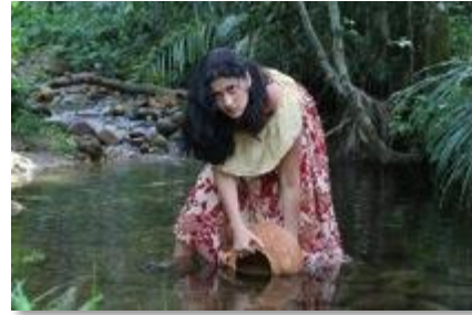
Fotograma del cortometraje La Procesión .

In-seguridades tendrá una fotografía fría y un tanto desaturada, lo que marcará una distancia entre los personajes y el espacio, pues ellos sienten que están en un sitio donde no quieren estar. El banco, que es un personaje más, se convierte en el antagonista, y esta frialdad se ve reflejada en la fotografía.