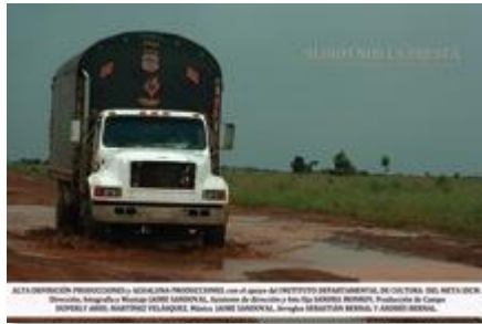
Afiche del documental Si Dios nos la presta .

Coprodutor y editor del cortometraje La procesión y guionista, director y montajista del documental Si Dios nos la presta .