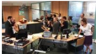
Making off del cortometraje Tu P*** banco.

PD: En Colombia, un corotmetraje de estas características se puede realizar con $40.000.000 colombianos (unos 13.000 euros).