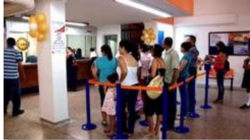
Congente. Banco local del departamento del Meta. Referente para el cortometraje.