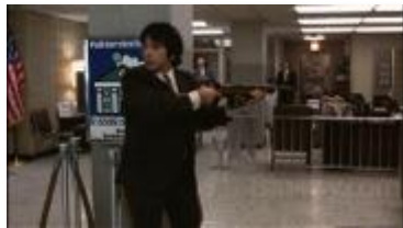
Tarde de perros.

In-seguridades tiene una fotografía fría y pálida, reflejando el ambiente bancario, muy parecido al de la película, antes mencionada, Tarde de perros .