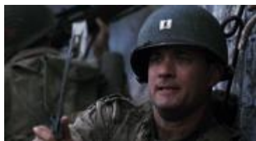
Rescatando al soldado Ryan.

In-seguridades tiene una fotografía fría y pálida, reflejando el ambiente bancario, muy parecido al de la película, antes mencionada, Tarde de perros .